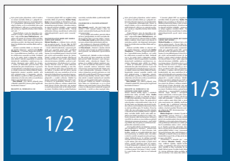
210 x 145* 73,5 x 297* 182 x 125 57,5 x 254 22 000 Kč/880 € 20 000 Kč/770 €